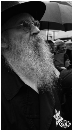
Nedávno se objevila ve vestibulech metra reklamní cedule, kde stálo: „Poznej židovskou Prahu“. Těch panelů bylo v me-

Ve středu naší krásné země, ba přímo v srdci Evropy, se nachází město, které bere dech a zároveň dává energii. Ale spoň co se jeho návštěvníků týče. Hlavní město České republiky je oblíbeným cílem českých výletníků i turistů z mnoha států světa. To musíme kvitovat a jednoznačně podporovat. Výletníky, turisty. Ale svou výhodnou polohou, příležitostmi a památkami, Praha nepřitahuje pouze je. Existují cizí vlivy, které Prahu neberou jen jako víkendové povyražení, ale jako prostředek pro své obohacení, pro šíření vlastních „hodnot“ a ovlivňování místních lidí. A naše, tedy snad stále ještě naše, Praha je těmito cizími prvky dosti zasažena.